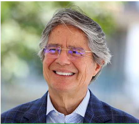
Guillermo Lasso Presidente