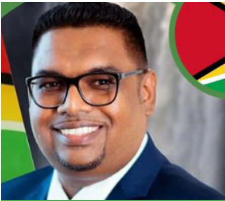
Mohamed Irfaan Ali Presidente