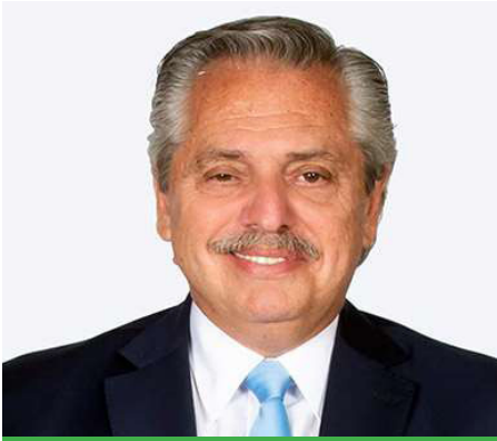
Alberto Fernández Presidente