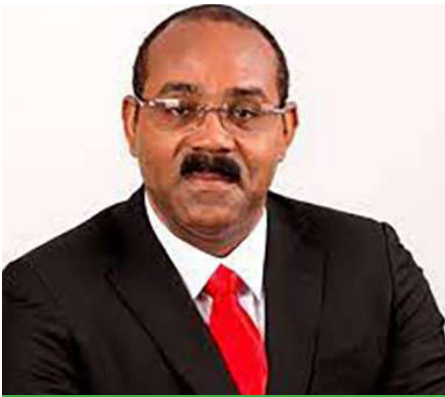
Gaston Browne Primer Ministro