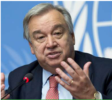
António Guterres Secretario General ONU