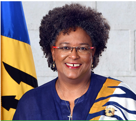
Mia Amor Mottley Primera Ministra