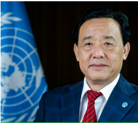
QU Dongyu FAO Director-General