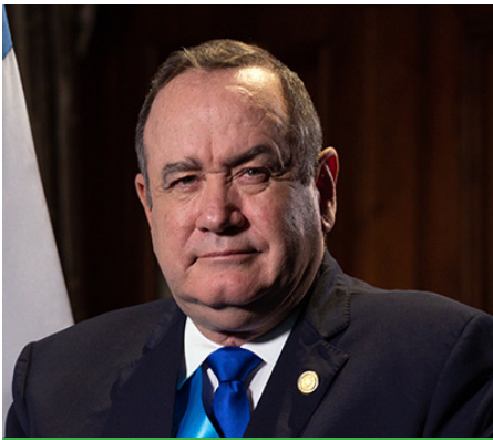
Alejandro Giammattei Falla Presidente