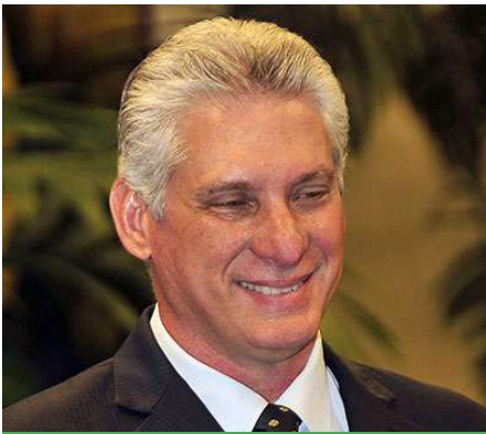
Miguel Díaz-Canel Bermúdez Presidente