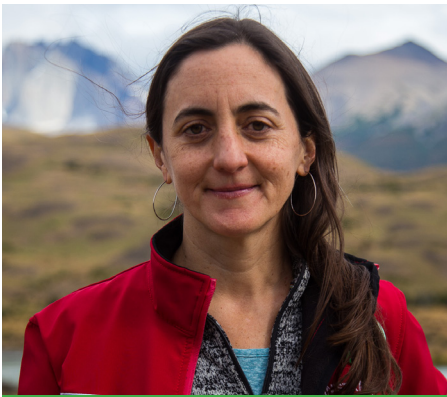
María Emilia Undurraga Ministra de Agricultura