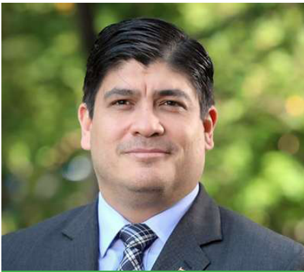
Carlos Alvarado Quesada Presidente