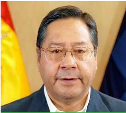
Luis Alberto Arce Catacora Presidente