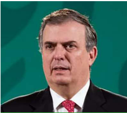
Marcelo Luis Ebrard Causaubó Ministro de Relaciones Exteriores

Entonces México participa en estas dos preocupaciones y desea manifestar su compromiso pleno para avanzar en una y otra con nuevas tecnologías, con políticas públicas, con medidas acordadas entre todos los países que nos permitan avanzar en esa dirección.