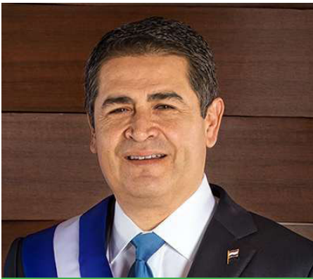
Juan Orlando Hernández Alvarado Presidente