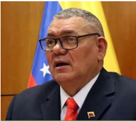
Carlos Leal Telleria Ministro del Poder Popular para la Alimentación