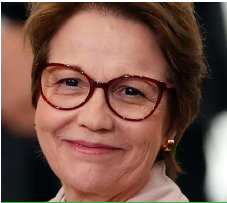
Tereza Cristina Corrêa da Costa Dias

Ministra de Agricultura, Ganadería y Abastecimiento