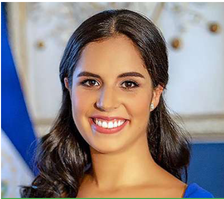
Gabriela de Bukele Primera dama