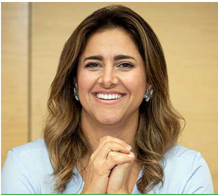
María Juliana Ruiz Sandoval Primera dama