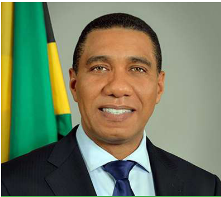
Andrew Holness Primer Ministro