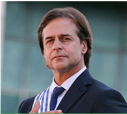
Luis Lacalle Pou Presidente