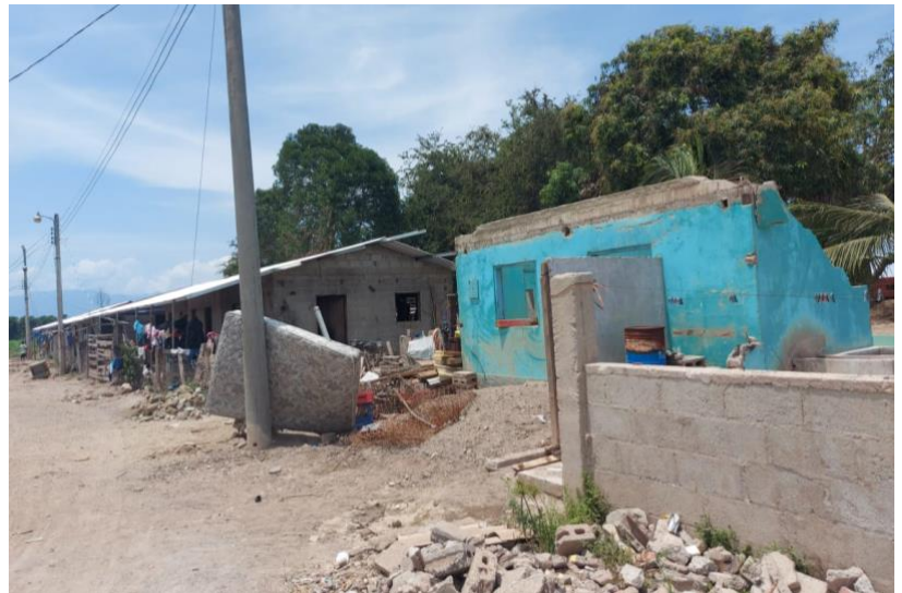
La Lima, Cortés a cinco meses del impacto