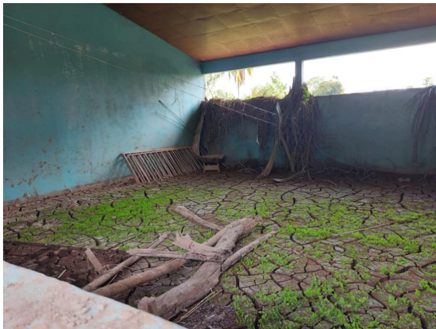
Escuela en Bordo Limones, Cortés

El país enfrenta una situación compleja, a cinco meses del impacto de las tormentas tropicales Eta e Iota, las necesidades humanitarias de centenares de comunidades en las zonas geográficas más afectadas - especialmente en el Valle de Sula- enfrentan grandes desafíos, como comunidades con viviendas destruidas y falta de la limpieza. De igual forma, enfrentan el grave peligro de la no reparación de diversos “bordos” de contención a lo largo de los ríos Blanco y Ulúa entre otros. Esto ha dejado a las poblaciones ante una inminente vulnerabilidad no solo ante las grandes tormentas tropicales, sino también a la temporada tradicional de lluvias. La matriz de priorización del impacto Eta e Iota realizado por UNICEF, encontró que alrededor de 1.127 comunidades que contemplan una población de alrededor de 417.000 personas, recibieron un impacto alto muy alto por las tormentas. Según COPECO, hay alrededor de unas 2.000 personas concentradas en unos 50 albergues, principalmente en el departamento de Cortés, con el 70 por ciento de los albergados y el resto